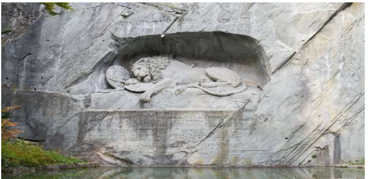
นำท่านข้ามพรมแดนสวิตเซอร์แลนด์ – อิตาลี

บ่าย จากนั้นพาท่านชมสิงโตหินแกะสลัก (Dying Lion of Lucerne) ที่แกะสลักบนผาหินธรรมชาติ เพื่อเป็นอนุสรณ์รำลึกถึงการพลีชีพอย่างกล้าหาญของทหารสวิสที่เกิดจากการปฏิวัติในฝรั่งเศสเมื่อปี ค.ศ.1792 ชมสะพานไม้ชาเปล (Chapel Bridge) ซึ่งมีความยาวถึง 204 เมตร ทอดข้ามผ่านแม่น้ำรอยส์ (Reuss River) อันงดงามซึ่งเป็นเหมือนสัญลักษณ์ของเมืองลูเซิร์น เป็นสะพานไม้ที่มีหลังคาที่เก่าแก่ที่สุดในยุโรป สร้างขึ้นเมื่อปี ค.ศ.1333 โดยใต้หลังคาคลุมสะพานมีภาพวาดประวัติศาสตร์ของชาวสวิสตลอดแนวสะพาน