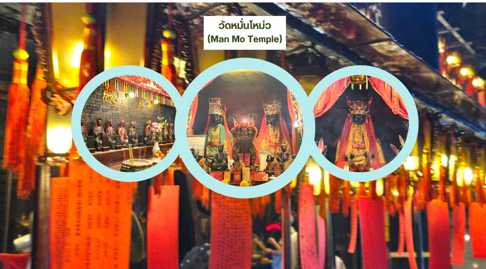
วัดหมั่นโหม่ว (Man Mo Temple)

เรียกว่ามาที่เดียวได้ขอพรกันครบเลย ไม่ว่าจะใครจะขอพรอันใดก็สมหวัง สมความปรารถนาทุกประการ