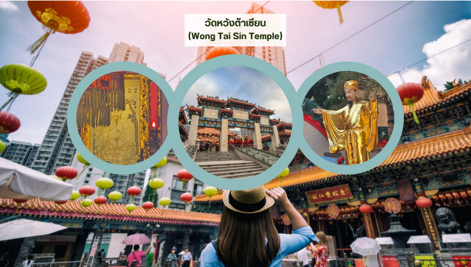
วัดหวังต้าเซียน (Wong Tai Sin Temple)

เช้า รับประทานอาหารเช้า ณ ภัตตาคาร บริการท่านด้วยเมนูติ่มซำฮ่องกง (มื้อที่ 3)