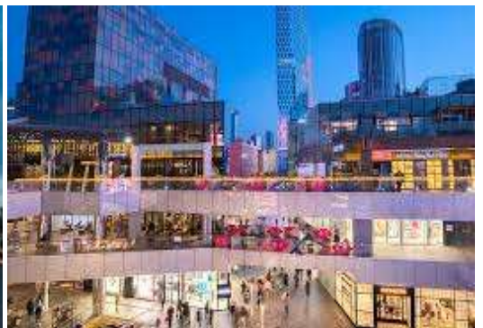
ที่พัก Holiday Inn Express Beijing shijingshan Lake View

วันที่ห้า วัดลามะ – ทำอากาศยานนานาชาติกรุงปักกิ่ง (TG615 : 17.05 - 21.15) – กรุงเทพ (สนามบินสุวรรณภูมิ)