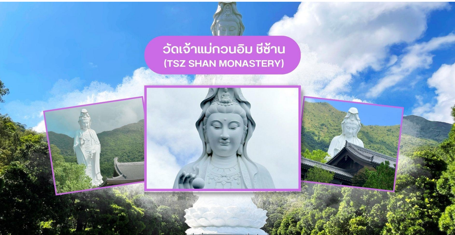
วัดเจ้าแม่กวนอิม ซีซาน (TSZ SHAN MONASTERY)

หมายเหตุ : เนื่องจากตัวเครื่องบินของคณะเป็นตัวกรู๊ปรระบบ Random ไม่สามารถล็อกที่นั่งได้ ที่นั่งอาจจะไม่ได้นั่งติดกันและไม่สามารถเลือกช่วงที่นั่งบนเครื่องบินได้ในคณะ ซึ่งเป็นไปตามเงื่อนไขสายการบิน ฮ่องกง เมืองแห่งสีสันและวัฒนธรรมที่ไม่เคยหลับใหล เป็นเมืองที่เต็มไปด้วยพลังและชีวิตชีวา ตั้งอยู่บนชายฝั่งทางตอนใต้ของจีน ที่นี่เป็นศูนย์กลางทางเศรษฐกิจ การเงิน และการท่องเที่ยวระดับโลกผสมผสานระหว่างวัฒนธรรมตะวันออกและตะวันตกได้อย่างลงตัว