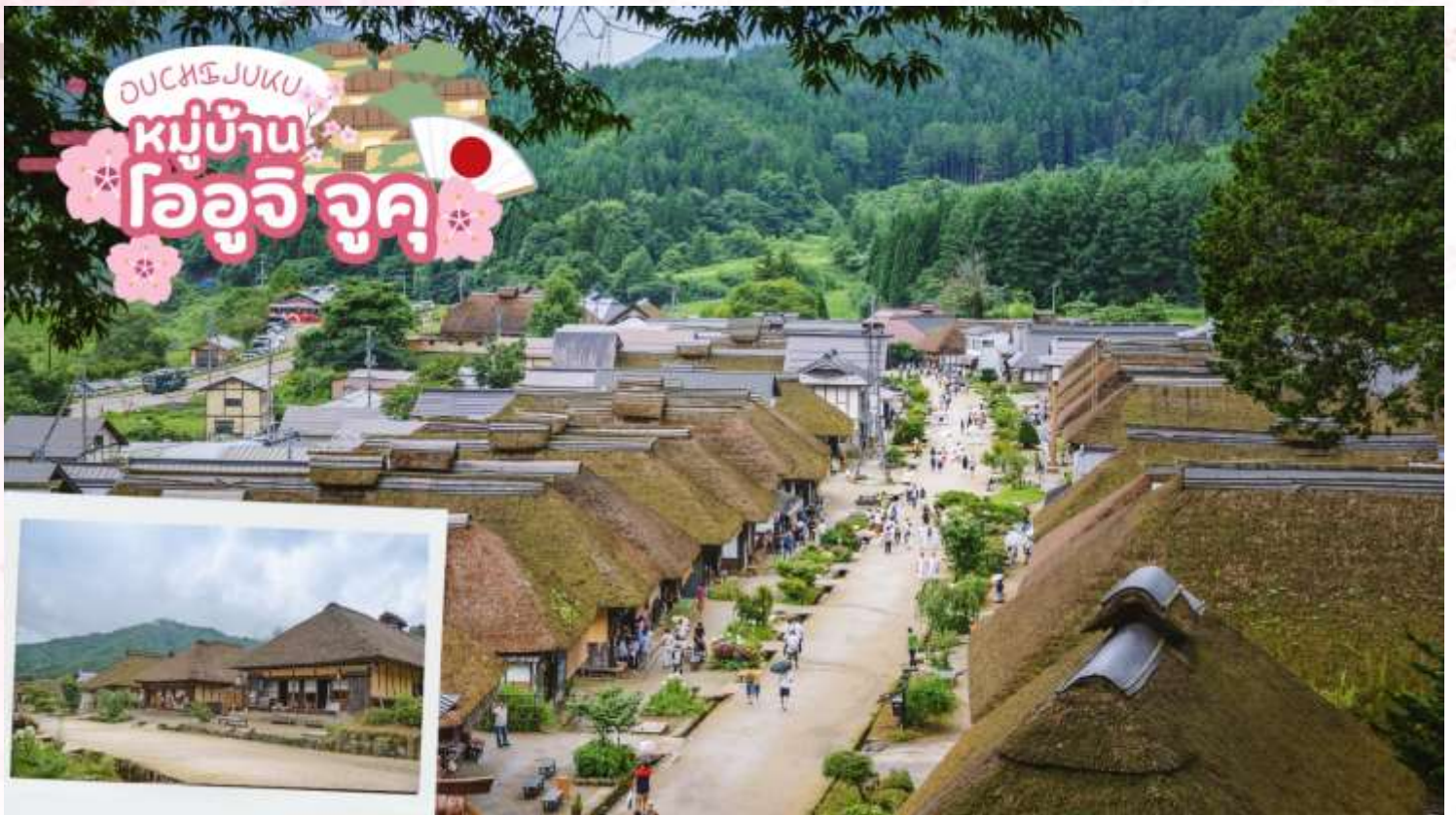
กลางวัน รับประทานอาหารกลางวัน ณ ร้านอาหาร (มื้อที่ 3)