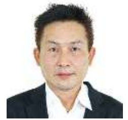
มัดคเทศก์