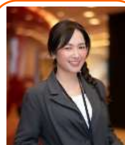
มัดคเทศก์