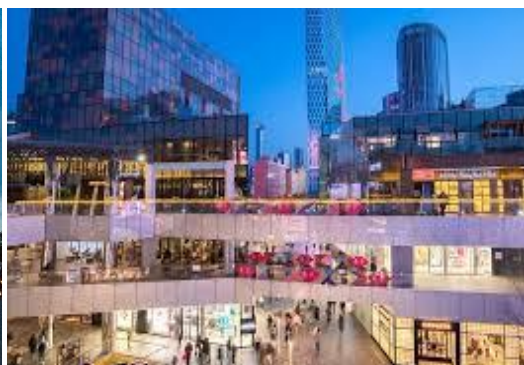
ที่พัก Holiday Inn Express Beijing shijingshan Lake View

วันที่ห้า วัดลามะ – ทำอากาศยานนานาชาติกรุงปักกิ่ง (TG615 : 17.05 - 21.15) – กรุงเทพ (สนามบินสุวรรณภูมิ)