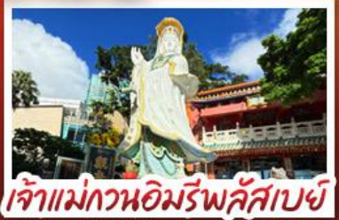
เจ้าแม่กวนอิมรัฟลีสเบย์