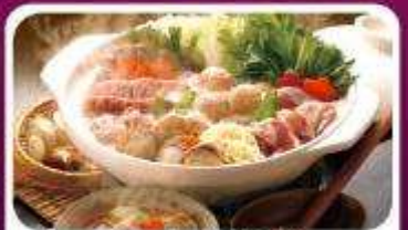
หม้อไฟสไตล์ญี่ปุ่น