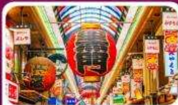
ตลาดปลาคุโรมง