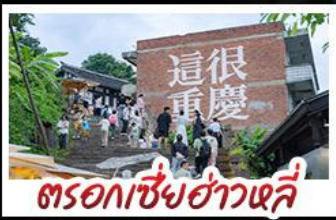
ตรอกเซี่ยอ่าวหลี่