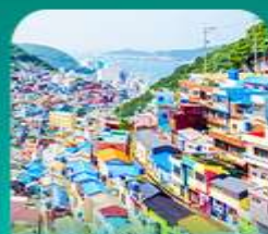
หมู่บ้านดั้งเดิมซอน