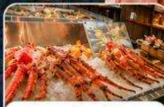
ตลาดปลาคุโรเมง