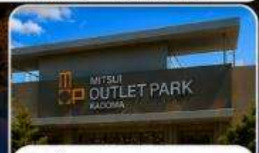
ช้อปปิ้ง MITSUI OUTLET KADOMA