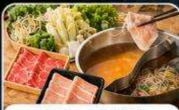
บุฟเฟ่ต์ซาบุสโตลญี่ปุ่น